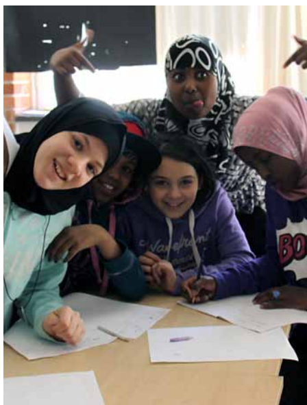
Glada deltagare i en av Seriefrämjandets serieworkshops.